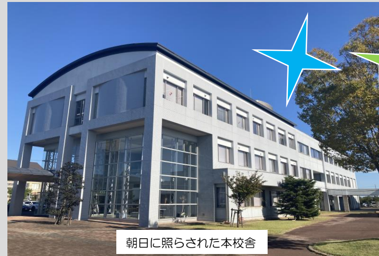
朝日に照らされた本校舎