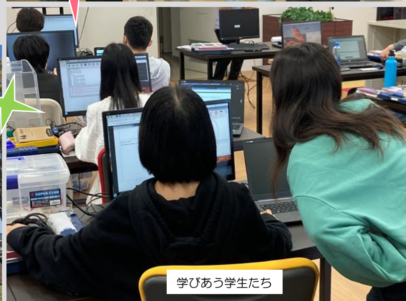
学びあう学生たち