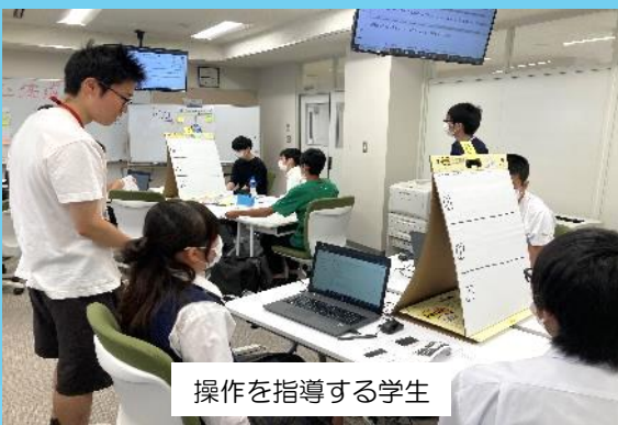
操作を指導する学生