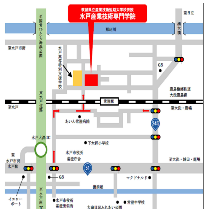
選考試験場所案内地図