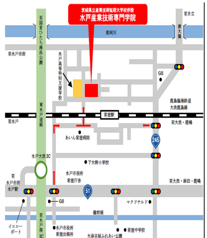
選考場所案内地図